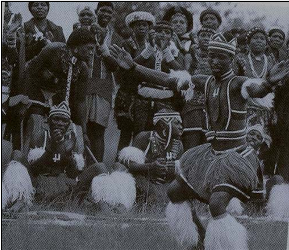
[Setshwantsho se qotsitswe bukeng ya Mohaladitwe wa Puo : Kereiti ya 10: 148]

Letsatsi la 24 Loetse ke letsatsi la phomolo leo re lokelang ho keteka botjhaba ba rona ka lona, empa boholo ba batho ha bo le keteke ka tshwanelo. Ba phetha mabaka a bona a fapaneng ka letsatsi leo. Ebe letsatsi lena le ntse le loketse ho behellwa ka thoko e le la phomolo? Ngola moqoqo oo ho wona o ntshang maikutlo a hao a dumellanang le a hananang le hore letsatsi lena e be la phomolo. Sehlooho sa moqoqo e be: