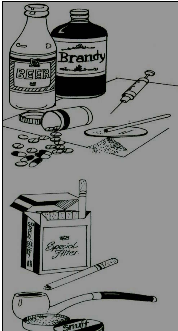
[E qotsitse bukeng ya Mohaladitwe wa Puo : Kereiti ya 10: 79]