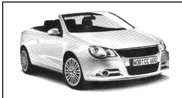
[Segarona, BN Kgosikoma le ba bangwe]

Sekaseka setshwantsho se se fa tlase, mme morago o thale papatso e mo go yona o ngokang kgathhegelo ya bareki go reka sejanaga sa gago.