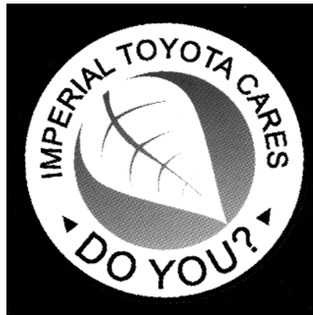
Die 'nuwe' Toyota-logo